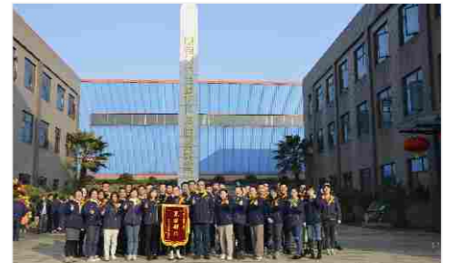
先进部门奖 泵业营销部