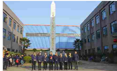
总裁特别奖 中石化项目小组