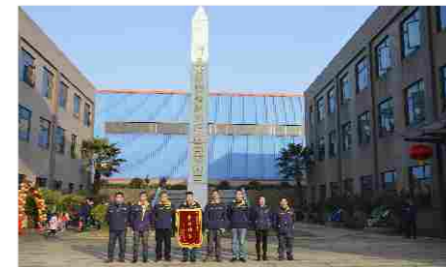
先进班组奖 熔炼班