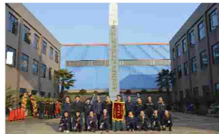
先进班组奖 叶轮主轴班