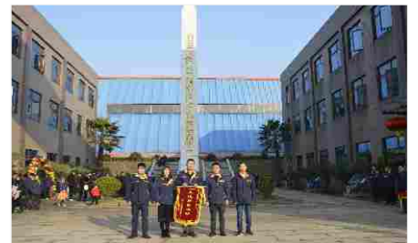
先进职能小组 总工办服务组